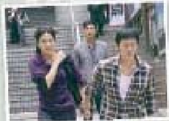
拍《溏心風暴之家好月圓》期間，我真係好愛自己演與佢啲戲，因為我太多個人個角色，但真係拍完之後好快就忘。