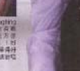
林峯與嘉賓蔡卓妍 (Jessa)、楊千嬅、王祖藍、泳兒、Laughing鄺謝天華等等，可謂群星拱照。