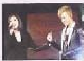
林峯與嘉賓蔡卓妍 (Jessa)、楊千嬅、王祖藍、泳兒、Laughing鄺謝天華等等，可謂群星拱照。