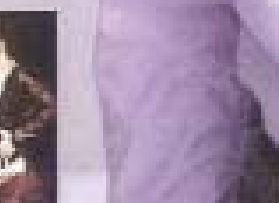
林峯與嘉賓蔡卓妍 (Jessa)、楊千嬅、王祖藍、泳兒、Laughing鄺謝天華等等，可謂群星拱照。