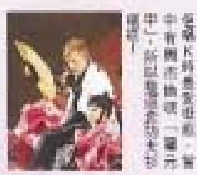
林峯與嘉賓蔡卓妍 (Jessa)、楊千嬅、王祖藍、泳兒、Laughing鄺謝天華等等，可謂群星拱照。