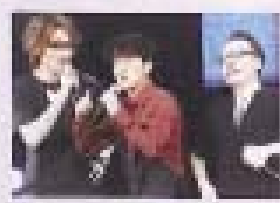
林峯與嘉賓蔡卓妍 (Jessa)、楊千嬅、王祖藍、泳兒、Laughing鄺謝天華等等，可謂群星拱照。