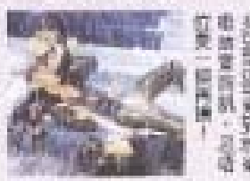
林峯與嘉賓蔡卓妍 (Jessa)、楊千嬅、王祖藍、泳兒、Laughing鄺謝天華等等，可謂群星拱照。